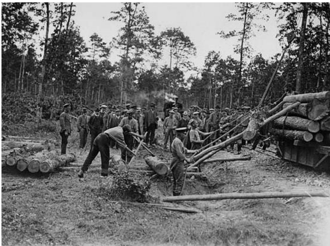
Le CFC au travail dans Les Landes

Sore (Landes), à Captieux (Gironde) et à Houeillès (Lot-et-Garonne). Il y eut aussi de nombreuses autres implantations de troupes américaines en Gironde, notamment à Bordeaux (état-major), Bassens (installations portuaires) et à Talence (hôpital). Après la guerre, un monument commémoratif fut érigé au Verdon-sur-Mer (Gironde) en hommage aux alliés américains.