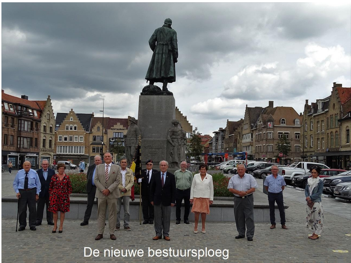
De nieuwe bestuursploeg