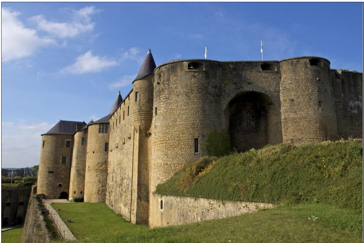
Het Fort van Sedan