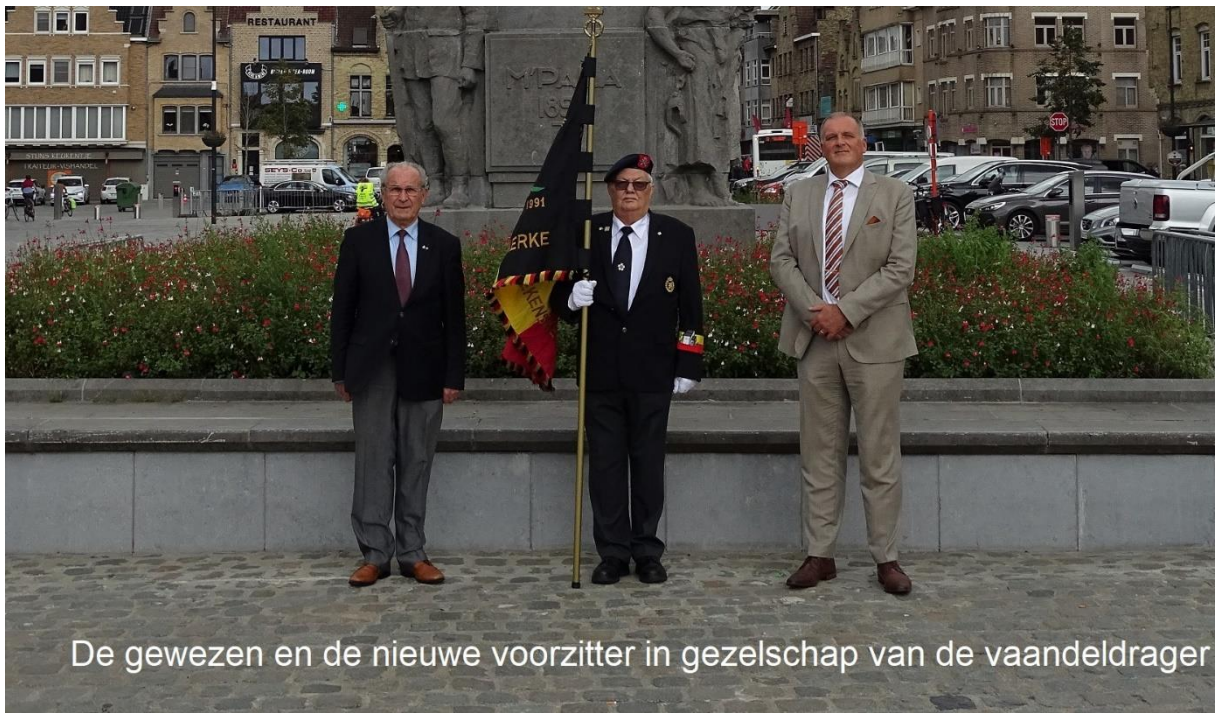
De gewezen en de nieuwe voorzitter in gezelschap van de vaandeldrager