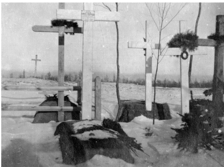
Belgische graven in Tarnopol voor WOII

Pogingen om de gesneuvelden naar België over te brengen waren niet bijzonder succesvol. De Sovjetregering liet weten dat de begraafplaatsen in Kiev en Moskou tijdens de revolutie verwoest werden en de graven onmogelijk nog te herkennen. De toestand op de begraafplaats in Tarnopol is verwarrend. De Belgen lagen begraven op de stedelijk begraafplaats van Tarnopol. Dat was Pools grondgebied tot in 1939. Het origineel perk met de ACM-gesneuvelden is al lang verdwenen. Het nieuwe perk met zes betonnen kruisen en twee gedenkplaten is een memoriaal ter ere van de Belgen. Het werd ingewijd in 2007. Eén gedenkplaat herdenkt het ACM, op het andere staan de namen van de ACM-gesneuvelden.