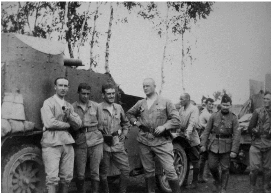
Belgische ACM-gevechtseenheid

Dan begint een onwaarschijnlijke odyssee voor deze jonge soldaten en brengt hen over de hele wereld. Op 21 september 1915 schepen te Brest 370 officieren en soldaten van het ACM in op een Britse cargo met bestemming Archangelsk in Rusland. Ook het materiaal voor twee batterijen (12 ACM wagens), een compagnie cyclisten, een batterij cyclisten en een depot voor wisselstukken reizen mee naar Rusland.