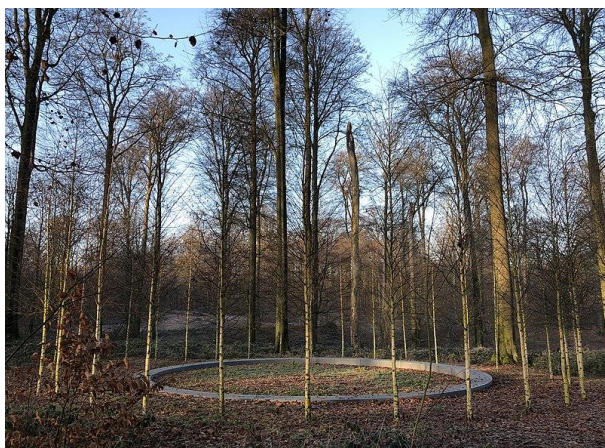
Onument in het Zoniënwood in Brussel

Binnenkort wordt het jaar 2021 afgesloten. Het werd weerom een moeilijk jaar. De coronapandemie hield ons gevangen en bracht in veel families veel leed door ziekte of het verlies van een geliefde. Wereldwijd stierven meer dan 5 miljoen mensen, en dat is hoogstwaarschijnlijk nog een onderschatting. Het dalen en terug stijgen van het aantal besmettingen maakte het moeilijk om onze vrijheid te herwinnen. We leven nog steeds in grote onzekerheid voor de toekomst. Het enige positieve lichtpunt was de succesrijke vaccinatiecampagne en de massale burgerzin van het overgrote deel van de bevolking om hieraan mee te werken en zich te laten inenten of om als vrijwilliger te helpen aan dit grootse massaproject.