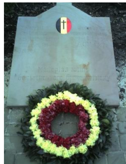
Nieuw Memoriaal voor de ACM-gesneuvelden